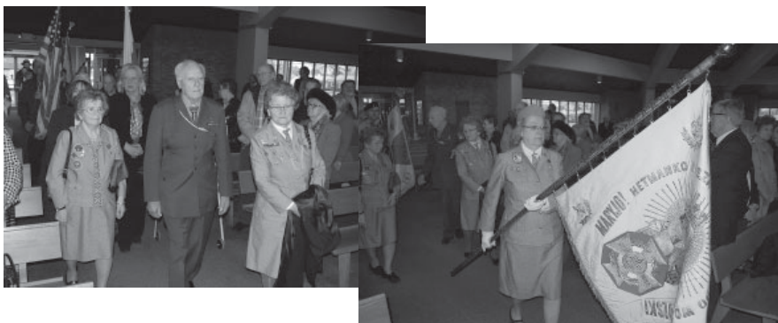
Zdjęcia z uroczystości obejrzyć można na stronie internetowej KPA - www.pacmi.org .

Po Mszy wszyscy obecni zostali zaproszeni na poczęstunek przygotowany przez członków detroickiej Rodziny „Radia Maryja”.